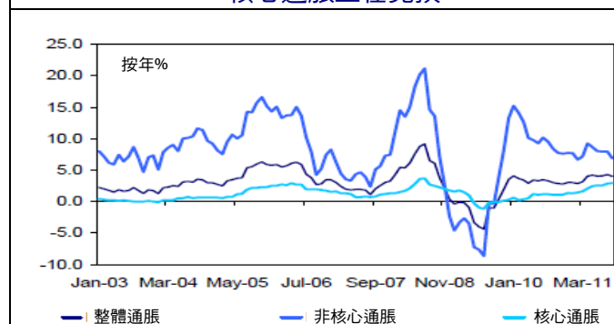
核心通脹正在見頂